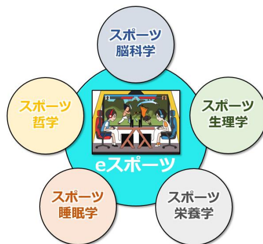
eスポーツの価値をスポーツ科学で探求